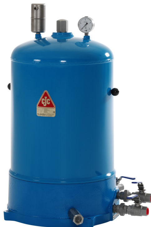
CJC™油质吸收过滤器 W 38/50